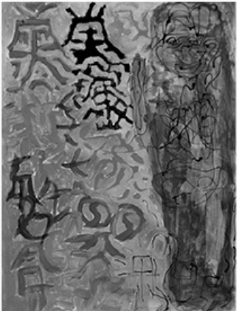
"Storyteller" ໂດຍ Shirley How ຈັດສະແດງຢູ່ www.niadart.com