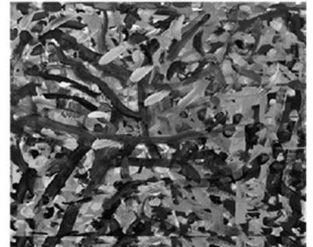
"Untitled" ໂດຍ Mia Brown ຈັດສະແດງຢູ່ www.niadart.com

ພາລະກິດ: ພວກເຮົາສົ່ງເສີມສະໜັບສະໜູນ, ໃຫ້ການສຶກສາອົບຮົມ, ສືບສວນສອບສວນ, ແລະ ດຳເນີນຄະດີ ເພື່ອສົ່ງເສີມ ແລະ ບົກປ້ອງສິດທິ ຂອງຜູ້ພິການຊາວລັດຄາລິຟໍເນຍ.